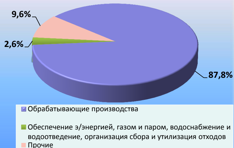
Структура промышленного производства

Оборот розничной торговли 7,8 млрд.рублей (101,6%)